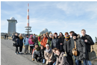
På udveksling i Aschersleben

Latin: Romerrigets sprog, ophav til alle romanske sprog. Grundmodel for sprogtilegnelse.