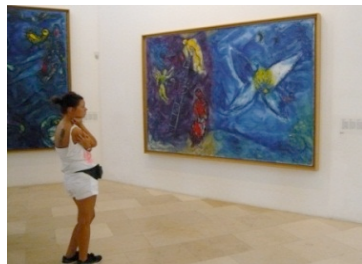
Chagall-museet i Nice

Please, bitte, por favor, s'il vous plaît, si placet! Bonjour, buenos días, guten Tag, hello, salve!